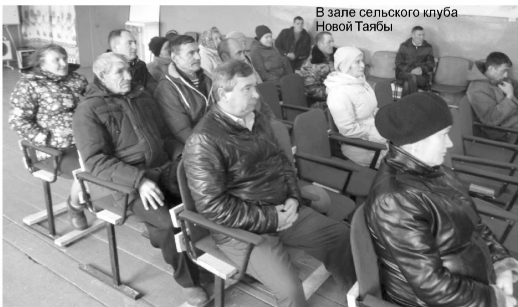
В зале сельского клуба Новой Таябы