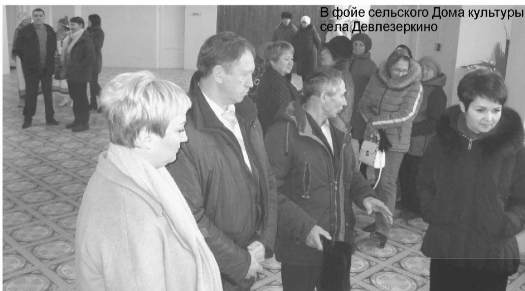
В фойе сельского Дома культуры села Девлезеркино

КАМЕННЫЙ БРОД. В ДК «Черемшан», построенном в селе в далёком 1966 году на средства совхоза «Каменный брод», произошли большие перемены. Пришедшие на мероприятие в честь открытия ДК сельчане по достоинству оценили проведённый капитальный ремонт, который коснулся буквально всего. Потолки, стены, полы, сцена, окна выполнены из современных материалов. В зрительном зале установлены мягкие сидения. Полностью заменена протекающая ряд лет крыша, смонтированы новые системы отопления и освещения. На первом этаже обустроена детская игровая комната. Заново отделан большой балкон на втором этаже, на котором располагается библиотека с фондом, насчитывающим 14 тысяч экземпляров, проведены другие работы. Конечно, на всё это были нужны финансовые вложения. Их удалось привлечь из благотворительного фонда Самарской области «Содействие», компании «РИТЭК», других источников.