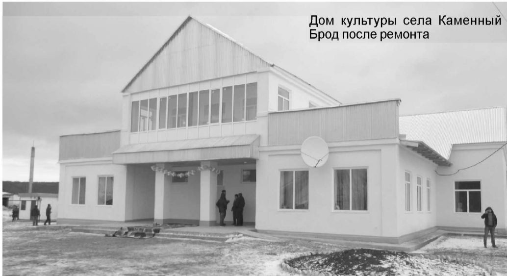
Дом культуры села Каменный Брод после ремонта

2 и 4 ноября в сёлах Каменный Брод, Новая Таяба и Девлезеркино состоялись мероприятия, посвящённые завершению работ по ремонту (капитальному или частичному) сельских домов культуры. Важные события в жизни сёл привлекли большое внимание, причём не только местных жителей